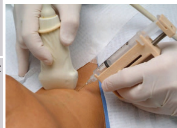
Fig. 9 Execução de um exame citológico por biópsia aspirativa de agulha fina.