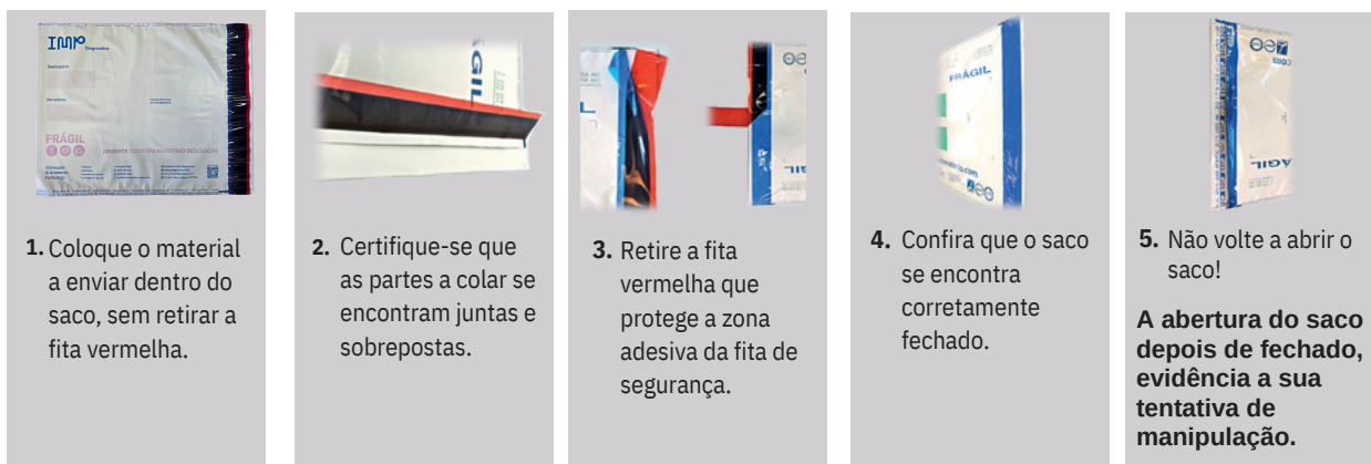
Fig. 4 Instruções de acomodação.