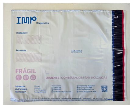
Fig. 3 Sacos de envio de amostras biológica.

A entidade que envia as amostras biológicas deverá colocá-las num saco fornecido pelo IMP (personalizado com os dados do laboratório).