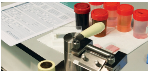
Fig. 5 Microtomo portátil para exames extemporâneos.

Os exames extemporâneos podem ser marcados em todo o território nacional, com deslocação de patologista e técnico de anatomia patológica ao bloco operatório. Para fazer o pedido solicita-se um contacto prévio com o IMP Diagnostics (22 60 54 481) com a antecedência mínima de 24 horas, indicando o local, dia, hora, médico responsável e o tipo de cirurgia em questão.