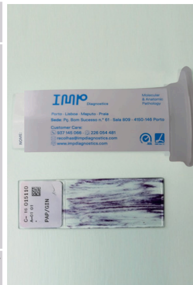
Fig. 8 Porta lâminas e respectiva lâmina.