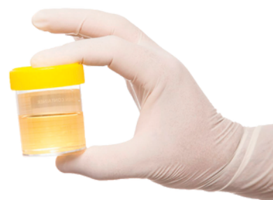
Fig. 11 Urina armazenada após colheita.