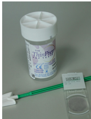
Fig. 7 Frasco de citologia líquida, escovilhão e lâmina.

A partir da mesma colheita em meio líquido é possível, para além do exame citológico, realizar técnicas de biologia molecular, desde que haja células suficientes.