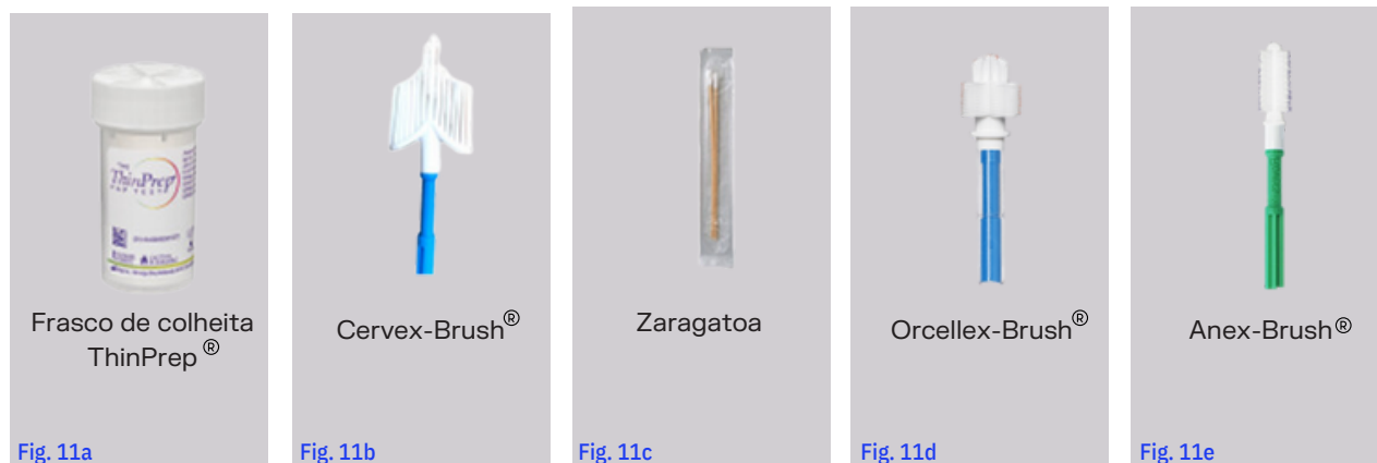
Fig. 11 Instrumentos de Colheita.

As recomendações para a colheita, assim como os instrumentos adequados para esta, variam com a topografia da amostra.